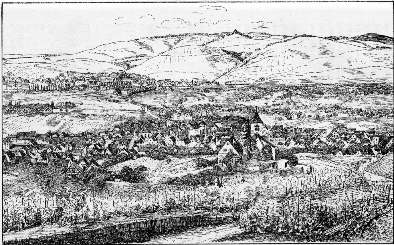
Wangen. (Nach einer Zeichnung von G. Drisk.)