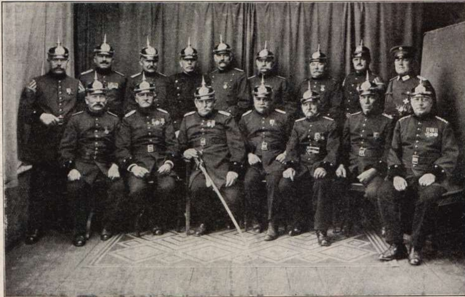
Der derzeitige Verwaltungsrat